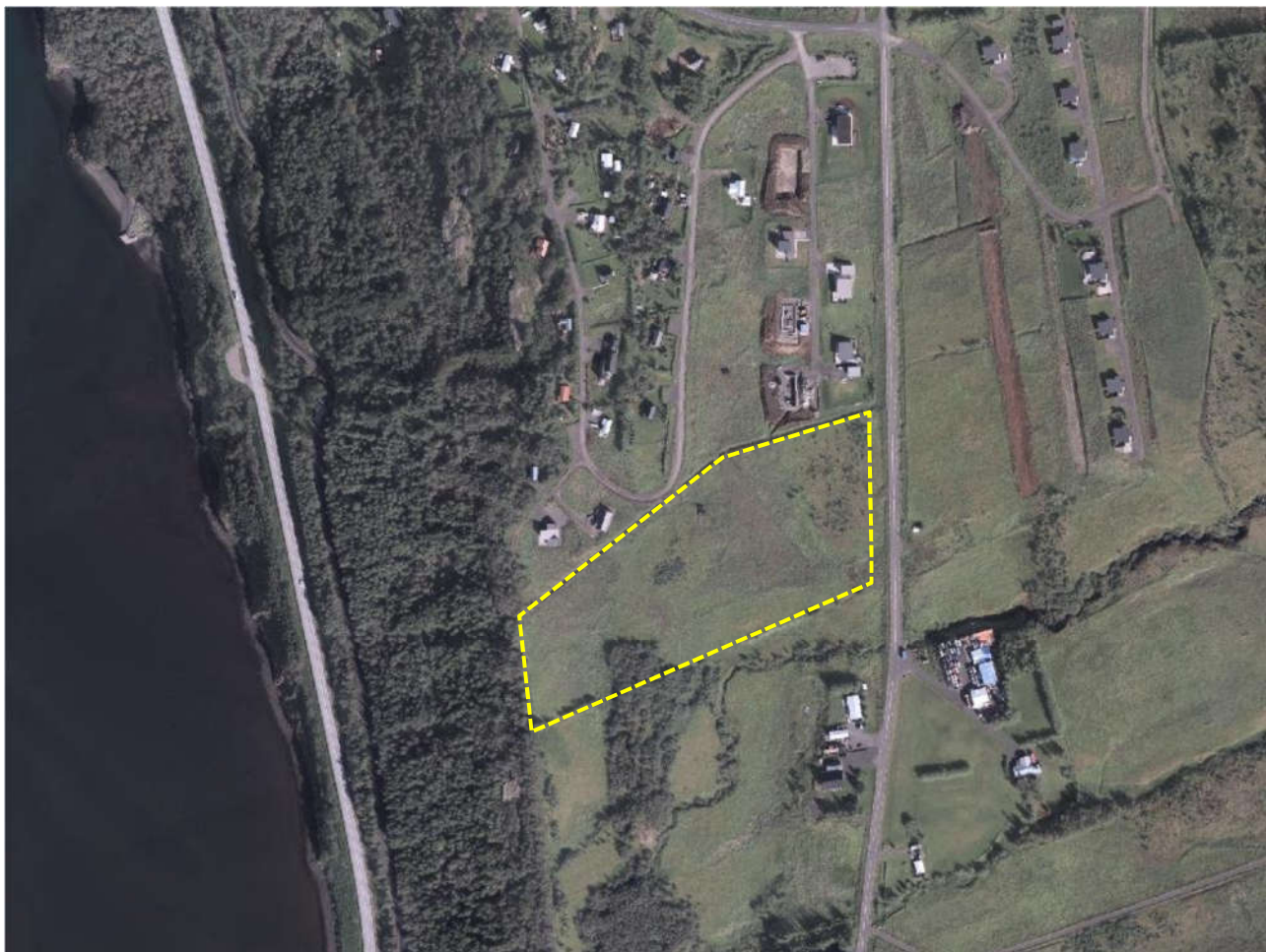
Mynd 1. Skipulagssvæði deiliskipulagsins er afmarkað með gulri línu.

Skipulagssvæðið er að mestu aflögð tún og ræktarland með stöku trjáþyrpingum.